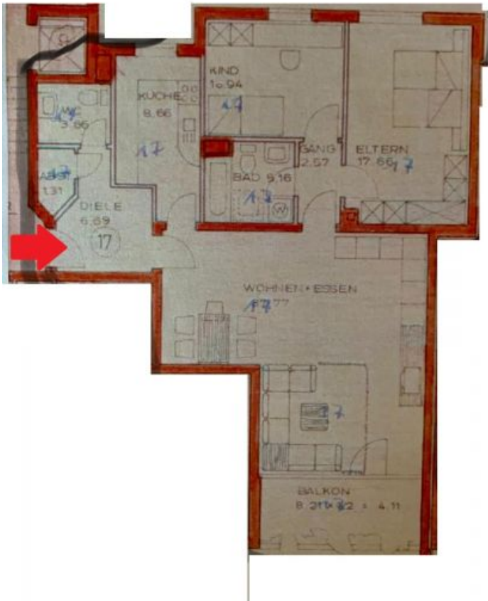
Grundrissplan der Wohnung