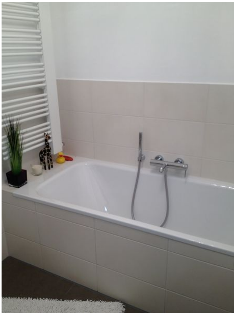
Bad mit Wanne & Dusche